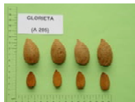
'Primorskiy' x 'Cristomorto' (1975)