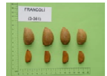
'Cristomorto' x 'Tuono' (1976)