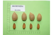
'Primorskiy' x 'Cristomorto' (1975)