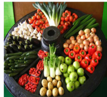
Fruites i verdures

Anomenem residus el conjunt de substàncies químiques que, com a conseqüència dels tractaments fitosanitaris, romanen en o sobre els vegetals tractats, o en els seus productes de transformació.