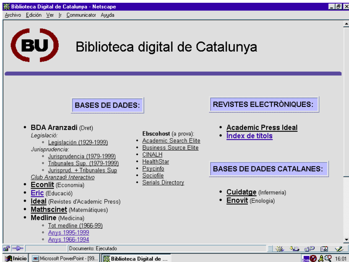
Figura 3: recursos de la biblioteca digital de Catalunya

Amb aquesta redirecció dels primers treballs, es va iniciar una fase de detecció d'ofertes que va consistir en seleccionar entre tots els serveis electrònics disponibles aquells que fossin més interessants per les biblioteques, els que donessin més garanties tècniques per la seva consulta (per velocitat d'accés i per qualitat del servei) i els que oferissin unes millors condicions econòmiques per la compra conjunta. Va seguir a aquesta, una fase de prova, negociació, contractació i instal·lació en la que es va intentar que els serveis contractats per a la BDC representessin un ventall ampli de les possibilitats actuals (accés remot i descàrrega local, bases de dades i revistes, proveïdors estrangers i nacionals...). A inicis de 1999 s'ha posat en funcionament la BDC amb l'oferta d'unes bases de dades i de revistes a text complet (figura 3) que cobreixen un nombre important d'usos i cobreixen diverses àrees temàtiques.